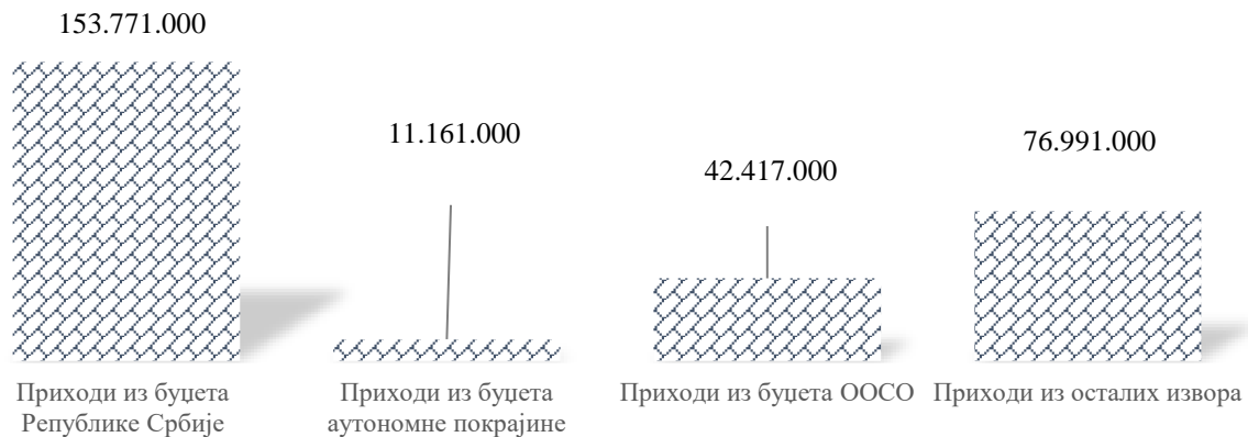
Слика број 2. Структура остварених прихода за обављање делатности социјалне заштите по изворима финансирања

Остварени приходи су распоређени за извршавање расхода датих у наредној табели.